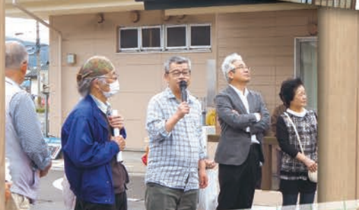
閉会挨拶をする甲田副実行委員長