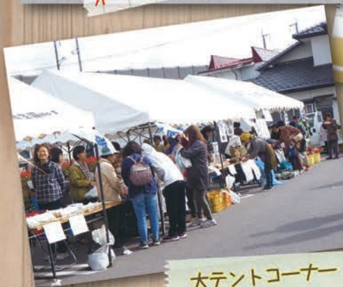
大テントコーナー