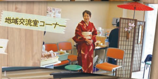
地域交流室コーナー