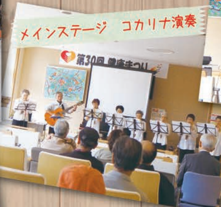
メインステージ コカリナ演奏