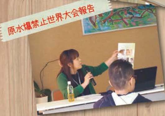
原水爆禁止世界大会報告