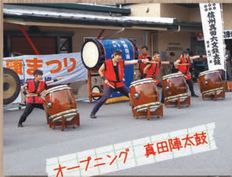
オープニング 真田陣太鼓