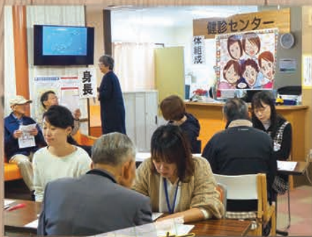
健康チェックコーナー