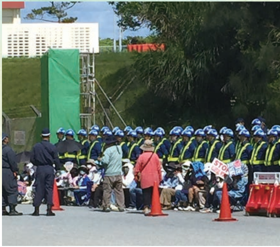
後ろに並んでいるのが機動隊 その前に座り込んでいます

8月21日、全日本民主医療機関連合会の呼びかけによる辺野古新基地建設に反対する座り込み行動の救護支援活動に参加してきました。 太陽が燦々と照りつける暑い一日でした。キャンプシユワブ前には若者から高齢の方まで30名を越える座り込み参加者が集い、「美ら海を守るぞー!」「頑張るぞー!」「負けないぞー!」と炎天下、日傘もささず頭に日よけのタオルをかぶり闘っていました。 周辺は厳重な警備体制が敷かれ、搬入時間になると土砂を積んだ50台以上のダンプカーが道路を占領します。ゲート前では1分でも1秒でも土砂の搬入を遅らせようと、参加者全員が横一列に並び全身で