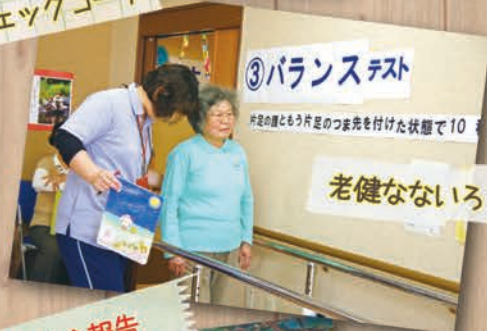
老健ないろコーナー